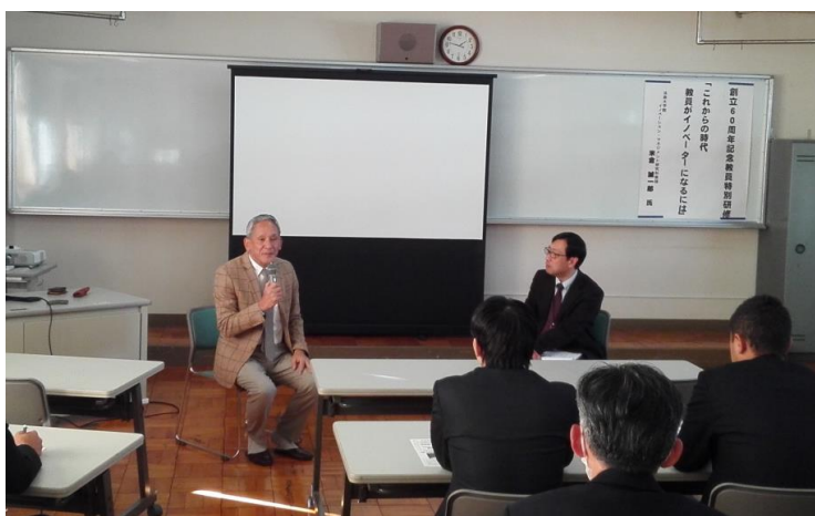
米倉氏と赤熊校長との対談の様子